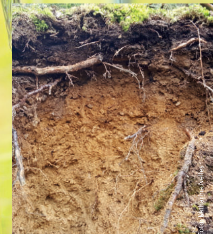
Hnědozem / Braunerde

Problémy s vyplavováním, znečištěním a erozí půdy však ukazují, že v zájmu ochrany našich životních zdrojů musí být znalosti o půdě lépe zakotveny v povědomí všech lidí.